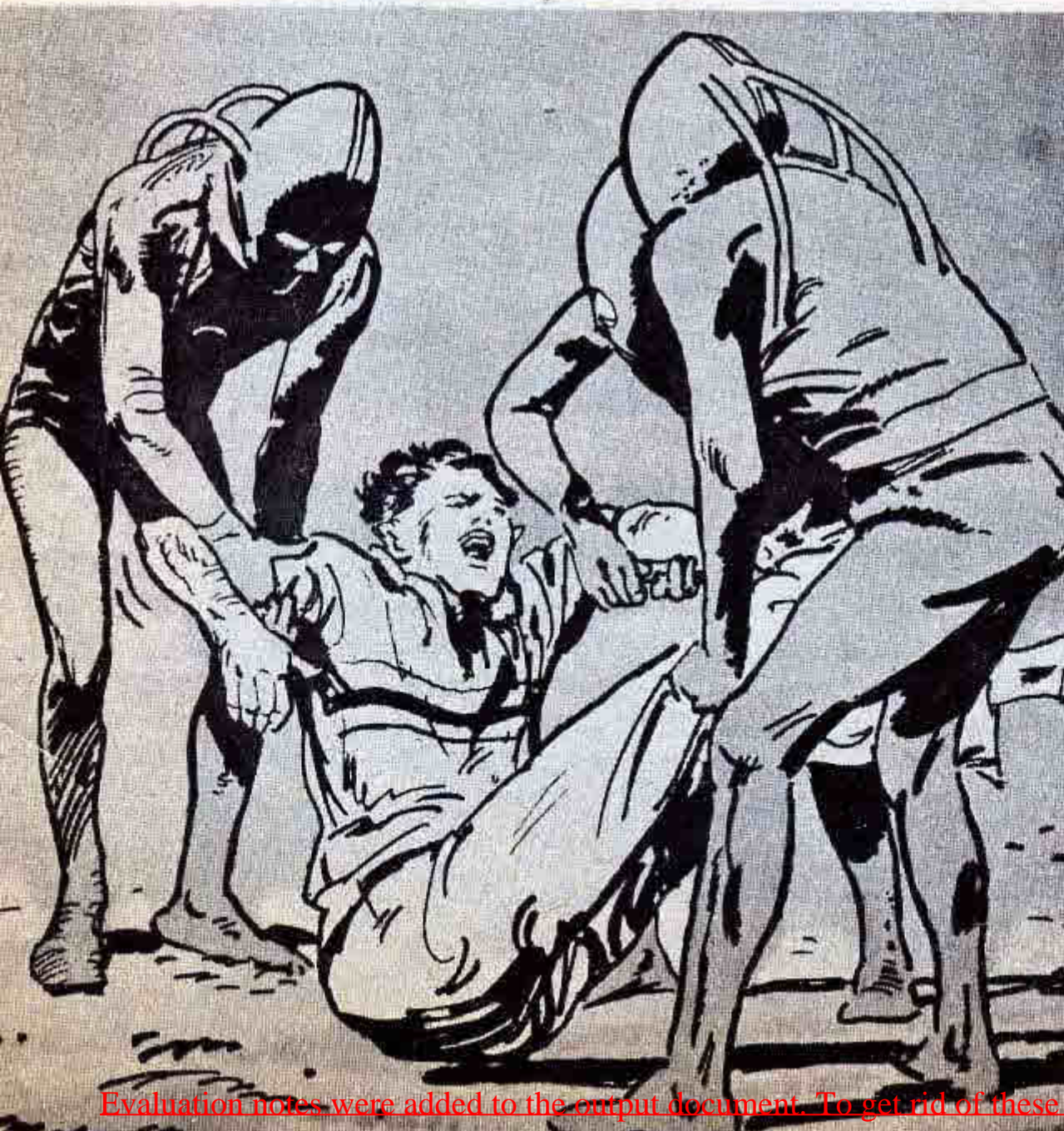
Con lujo de violencia, Antonio Villas Boas, fue llevado al interior de una nave extraterrestre. Ahí lo esperaba una mujer que hizo el amor con él. ¿Nació de esta unión una criatura, como algunos investigadores suponen?

Carl Higdon se encontraba cazando venados en Rawlins, Wyoming, el 25 de octubre de 1974. Había apretado el gatillo de su escopeta para ejemplar cuando se detuvo y percibió de "entidad". S