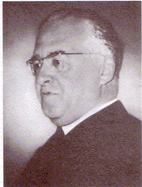
Figure 2.11 Georges Lemaître (1894-1966)