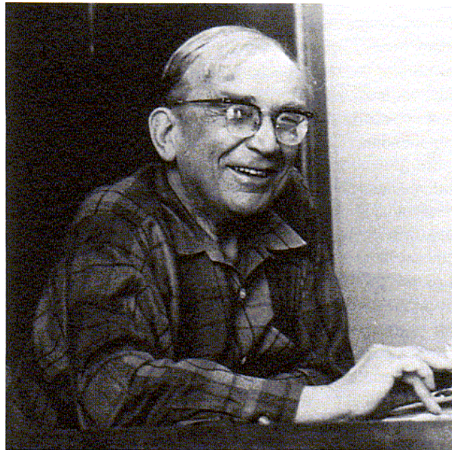
Figure 19.14. The Russian-American physicist George Gamow (1904–1968). While attempting to account for the production of all the chemical elements in the early universe, he realized that one of the consequences of the Big Bang would be what we now know as cosmic background radiation. Gamow was also a talented popularizer of science, writing many books for laypeople.

Con densidades mayores que 100 \text{ gr/cm}^3 y temperaturas superiores a 10^{10} \text{ K} se puede producir nucleosíntesis y Gamow, físico nuclear, se preocupó de calcular la posible nucleosíntesis ocurrida en el big-bang, pensando que la composición química del universo actual tendría su origen en el big-bang. Sólo calculó el Helio producido a partir del Hidrógeno. Sin embargo con el trabajo monumental de Burbidge, Burbidge, F. Hoyle y W. A. Fowler acerca de la nucleosíntesis en interiores estelares, que publicaron en 1957 y donde se explica en muy buena forma la mayor parte de las abundancias de los elementos pesados como producto de la nucleosíntesis en interiores estelares, se perdió interés en la teoría del big-bang y su explicación de la síntesis de los elementos.