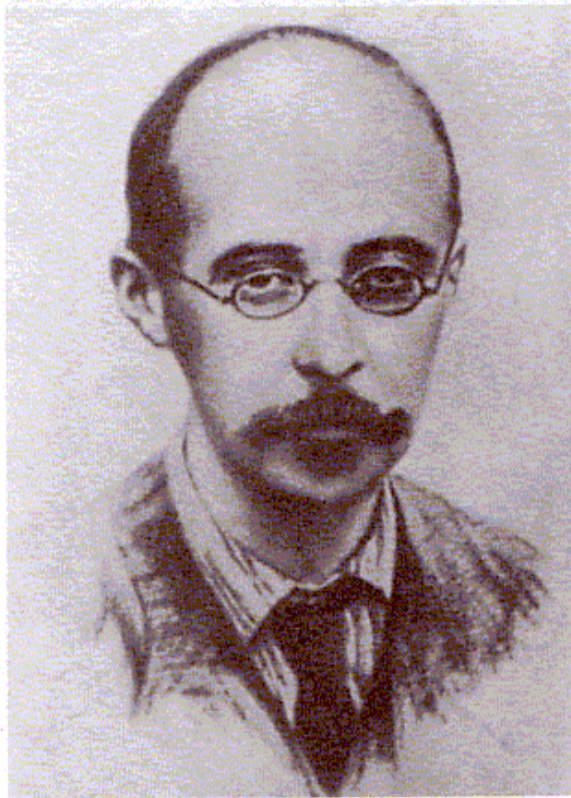
Figure 2.10 Alexander Friedmann (1888-1925)

En 1931 Lemaître propuso que el universo observable actual había surgido a partir de un estado de muy alta densidad que el llamó: “átomo primitivo” . Ese átomo primitivo contenía en un pequeño volumen toda la materia del universo actual. Según él esa forma de altísima densidad del Universo habría sido inestable, algo así como un gran átomo radioactivo que explotó y dio origen al universo actual.