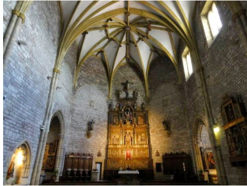
Retablo y ábside de dicha iglesia