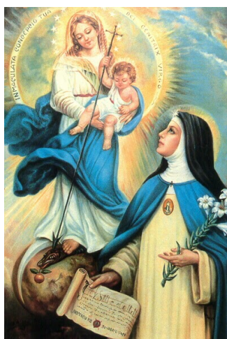
Aparición de la Inmaculada Concepción de santa Beatriz de Silva (S.