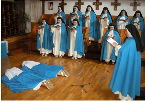
Monjas concepcionistas del convento de la Inmaculada Concepción y de santa Beatriz de Silva de Alcázar de san Juan (Ciudad Real).