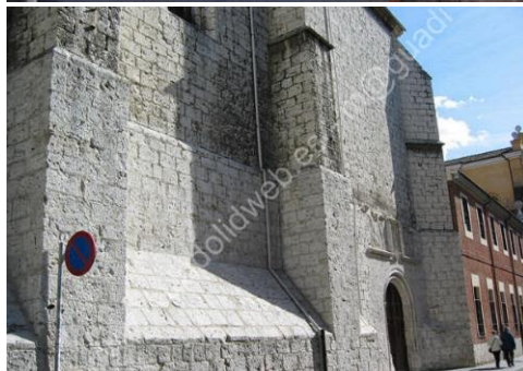
Fachada del Monasterio de La Concepción de Valladolid.

Cuando vista el hábito concepcionista tomará el nombre de sor M a de los Ángeles, por su devoción a los Santos Ángeles, a quienes se encomienda con fervor. Emitirá su profesión solemne el 6 de octubre de 1892 y desde entonces se entregará con todo su ser a Jesucristo y a María Inmaculada, tomando a ésta por Reina, Superiora, Maestra, Directora y Madre . Una actitud la acompañó siempre: A partir del día que hice la consagración conté con la Stma. Virgen para todo. Sentía la imperiosa necesidad de ser toda de Dios en María.