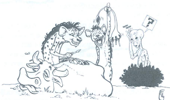
« C'est la faute aux animaux sauvages »