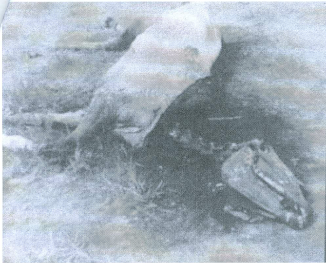
La jument Lady

d'une manière verticale de la tête presque jusqu'au poitrail et, chose horrible, la peau et la chair de la tête avaient été enlevées jusqu'à la base de l'encolure. (3 - p. 7, selon The Pueblo Chieftain, Pueblo, Colorado, du 7 octobre 1967).