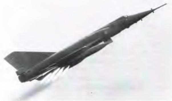
Les Mirage IV ont constitué, d'octobre 1964 jusqu'en 1996, la composante air de la force de dissuasion nucléaire française. Les survivants des 62 exemplaires de série sont ensuite devenus des avions de reconnaissance stratégique, et leur carrière a pris fin en juin 2005.