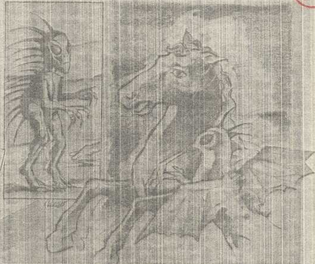
Concepción gráfica del 'Chupacabras' según las descripciones de testigos que alegan haber visto el extraño 'ser' que ataca aves de corral. (Ilustración por Jorge Vargas, de EL VOCERO).

La alegada presencia en el Oeste del llamado "chupacabras" tiene a muchos ni-