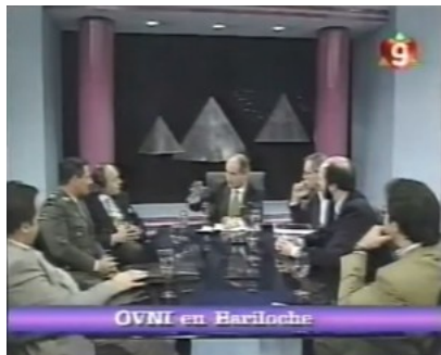
Testigos, ufólogos, periodistas y escépticos en "Memoria"