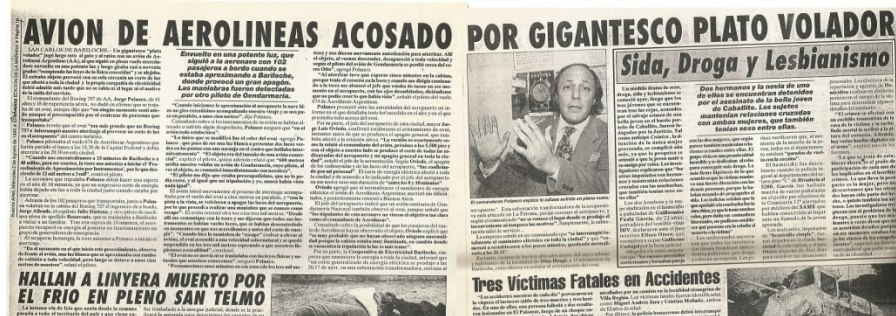
"Crónica", Miércoles 2 de Agosto de 1995