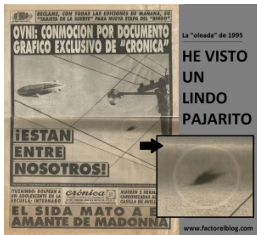
La Fundación CAIRP consulta a la Fuerza Aérea Argentina

Desde el primer momento intentamos obtener todos los datos a nuestro alcance. Fue así que recurrimos a la FAA para solicitarle información. Como respuesta recibimos las conclusiones a que había llegado la FAA luego de investigar el caso. Tales conclusiones son equivalentes a las nuestras. Por supuesto, una vez que la FAA estableció que ninguna aeronave convencional estaba transitando la zona en esos momentos, además del 727 y el GN705, consideró el caso cerrado, pues determinar la causa de los posibles reflejos en nubes o en la ventanilla del 727 podría haber sido un esfuerzo que llevaría mucho tiempo y sin garantías de éxito. Nosotros encontramos tal vez una explicación, pero la ofrecemos como probable y no como confirmada.