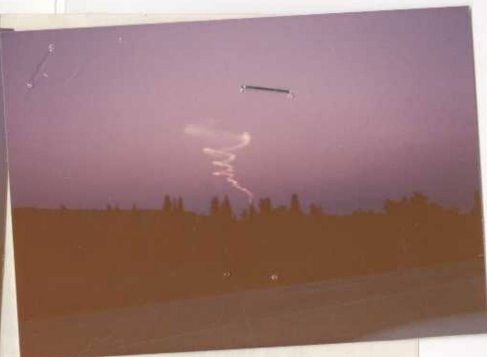
16 JULIO 1975

Faded, illegible text on the bottom page of the notebook, likely bleed-through from the reverse side.