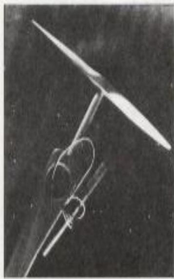
“helicóptero chino” de un tipo aún comercializado en Arkansas

enormes velocidades en línea recta combinada con la habilidad de sobrevolar y de moverse en ángulos rectos y en todas las direcciones- fuera reproducido por nosotros del mejor modo que pudimos en referencia a nuestros cohetes y helicópteros. Incapaces de combinar las características de pasmosa performance de los OVNI en un ingenio simple, nosotros producimos dos tecnologías completamente diferentes, cada una de las cuales mimetizan sólo un set de características de vuelo OVNI. Uno está tentado a ver a los OVNI como la representación visible de un trasfondo dinámico que nos estimula a producir esas tecnologías como parciales representaciones de algo como eso, en su esencia, irrepresentable y paradójico –una coincidentia oppositorum . Uno recuerda el comportamiento del héroe de Encuentros Cercanos del Tercer Tipo que se siente compelido a reproducir en forma material una vaga y elusiva imagen inconsciente.