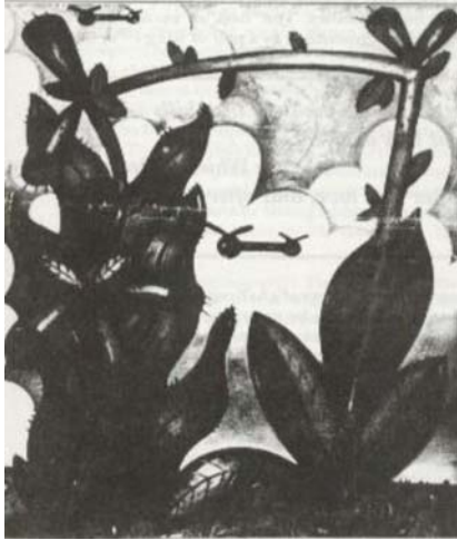
“Formas de Plantas y helicópteros” Richard Thompson (1987)

menudo esta condición aparece acompañada por una visión del cuerpo como máquina extendida 17 ha sido bien concebida por el artista OVNI naive, que produjo la litografía titulada “máquina aérea”. Esta imagen como-OVNI tiene clara semejanza de máquina, tanto como es obvio de una naturaleza muy orgánica. está compuesta de tendones y tejido esquelético que sugieren fuertemente las partes de uno o más cuerpos humanos. El “frasco” o vas hermeticum del tejido está coronado por un par de alas 18 en la posición de los rotores de un helicóptero. El conjunto del objeto parece estar emergiendo fuera de la base metafísica de existencia. (En la ilustración: “Máquina aérea” de Bradley Te