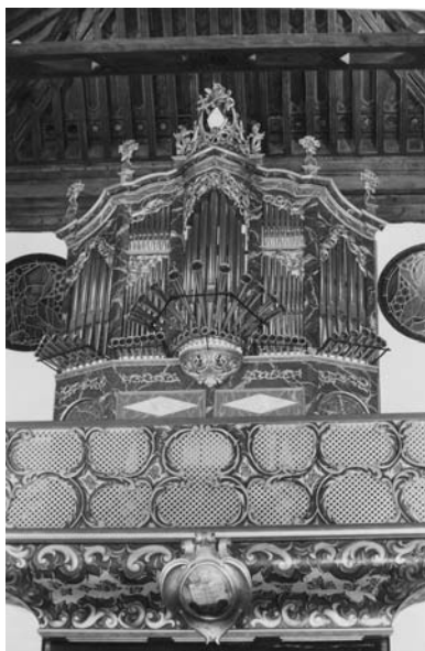
FIG. 1. Sevilla. Iglesia de San Isidoro. Órgano. Tras la restauración.