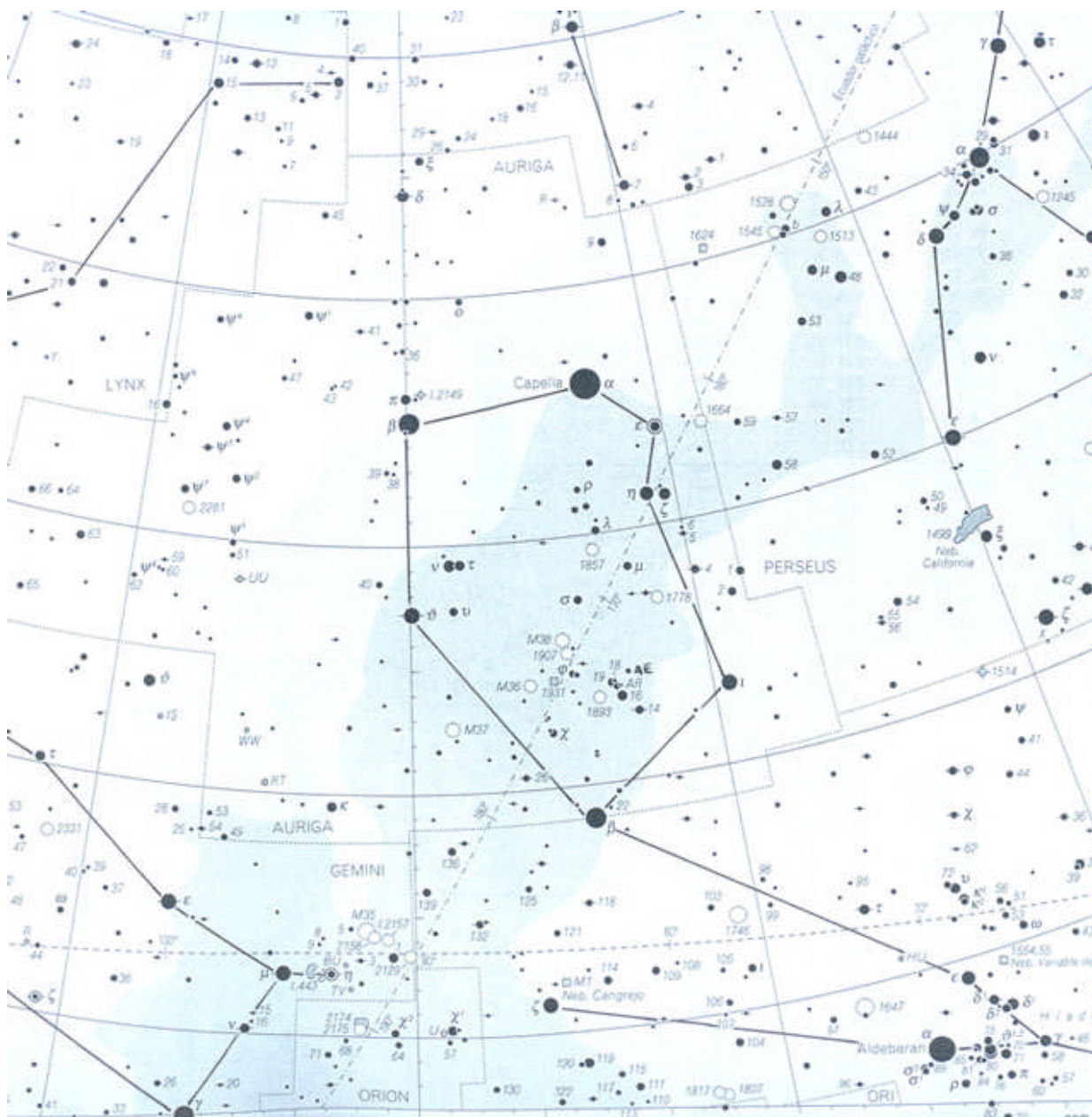
MAPA CELESTE (PARCIAL) CON LA LOCALIZACIÓN DE CAPELA, ESTRELLA (DE MAYOR BRILLO) DE LA CONSTELACIÓN DEL COCHERO