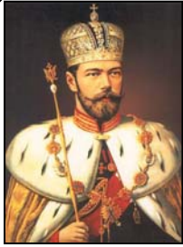
Nicolás II, último zar de Rusia, no destacó como gobernante, pero creía firmemente que su deber era preservar la monarquía absoluta.