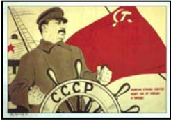
Cartel de propaganda de Stalin presentado como "el gran timonel del comunismo mundial".