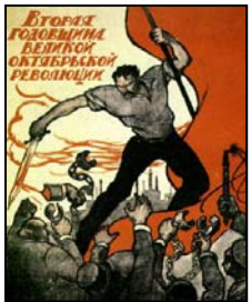
Los Bolcheviques (en ruso "mayoritarios") fueron una facción dentro del Partido Obrero Socialdemócrata de Rusia.