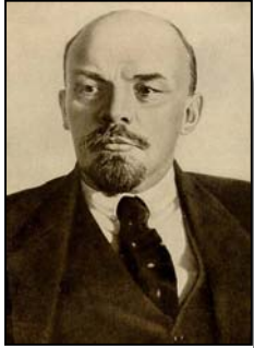
Lenin (Vladimir Ilich Uliánov) Revolucionario y teórico político ruso, fue el fundador del Estado que se convertiría en la Unión Soviética y presidente del primer gobierno establecido tras la Revolución Rusa de 1917.