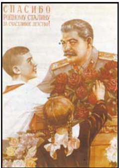
El régimen soviético siempre mostró al dictador con una imagen que transmitía dulzura y proximidad a la gente, muy diferente de la realidad