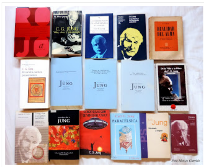
ALGUNAS OBRAS DE/SOBRE JUNG