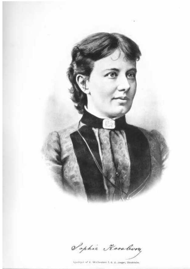
Sonja Kovalevsky (1850–1891)