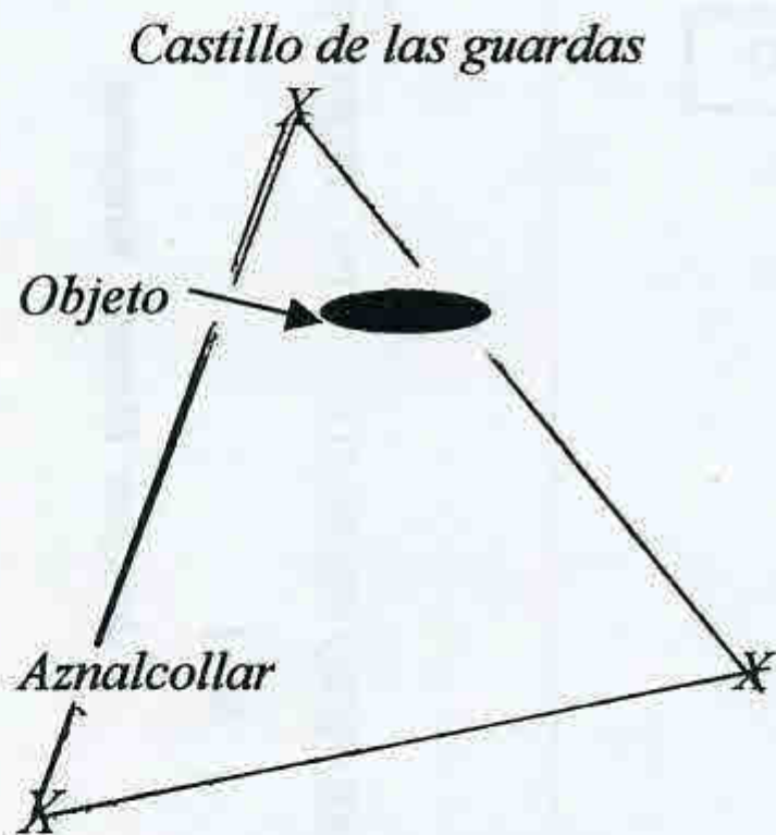
Formas del objeto

Los hechos acontecieron el pasado día 10 de mayo de 1999 a las 2'30 horas de la madrugada. El avistamiento fue contemplado desde la mina de Aznalcóllar estando de testigos varios camioneros y un vigilante de la citada mina. Según nos cuentan la duración del acontecimiento rondó los 30 minutos con una orientación del objeto sobre el triángulo formado por los pueblos de Aznalcollar, Gerena y el Castillo de las Guardas. Según los testigos el objeto presentaba un color azulado y de forma parecida a un calentador eléctrico circular. Según calculan los testigos el diámetro aproximado del objeto rondaba entre 50 ó 60 metros siendo de difícil calculo las medidas.